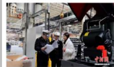
常州海关关员走进企业讲解技术性贸易措 施情况。

在常州，以庞大产业基础催生高级服 务平台的事并非孤例。作为“新能源之都”， 常州动力电池产业链完整度高达97%。当数 千亿元产值的产品走向全球，企业面临的是各 国复杂各异的技术法规和贸易壁垒。正是基 于此迫切需求，全国首个“新能源电池技 术性贸易措施研究评议基地”于今年初落地 常州。该基地通过专业研判，为我国出口产 品争取关键合规窗口，并主导参与了国际锂 电池安全运输标准的修订，将中国产业实践 转化为国际规则的话语权。