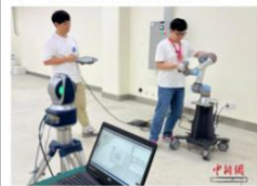
工业机器人接受“体检”。

在国家智能工业机器人产业计量测试中 心(筹)的实验室内，一台工业机器人正在重 复执行着高精度轨迹运动，激光跟踪仪实时 捕捉它的每一个微小偏移，数据在屏幕上跳 动——这是智能机器人“体检”的日常一幕。